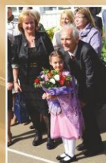
Вечные гринюские образы: Ассоль и Грив