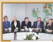
Встреча с администрацией Департамента