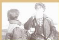
Усталым на ходу