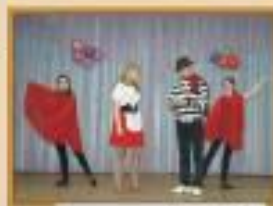
Актеры, 8 класс

Здравствуй, племя молодое, незнакомое, Театральная весна - традиционное мероприятие, в котором принимают участие ученики с 1-го по 11-й классы совместно с родителями.