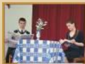
Актеры, 8 класс