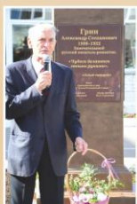
Выступление актёра В.С. Ланового

Памятник был передан в дар учебному заведению народным артистом СССР Василием Лановым и руководителем федерального проекта «Аллея российской славы» Михаилом Сердюковым.