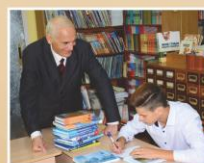
В библиотеке Гимназии