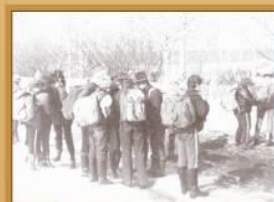
Так создавалась история школы

В школе кипела и краеведческая работа. Юные следопыты школы изучали родной край.