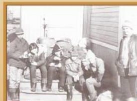
Приселки, друзья, перед дальней дорогой