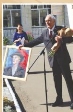
Портрет Грива – автор А. Блинова, ученица 11Б кл.