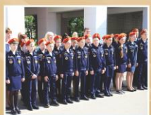
Кадетский класс на митинге