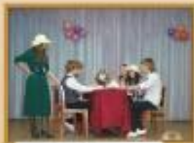
Актеры, 8 класс