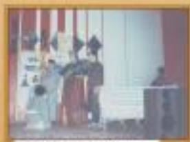
Актеры, 8 класс