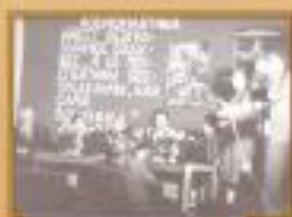
Встреча с гостем