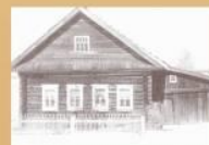
Дом космонавта ЗЮ в деревне Березкины