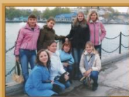
Поездка на олимпийские объекты