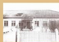
Школа, где учился космонавт, ст. Березкино