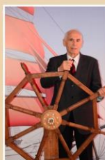
В.С. Лановой в кабинете А. Грина