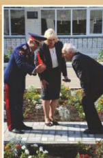
«Дымка» в подарок