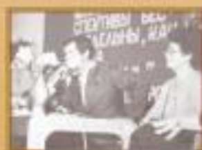
Встреча с гостем

Нашу школу посетило немало именитых гостей. Каждый из них оставил памятный след в жизни школы.