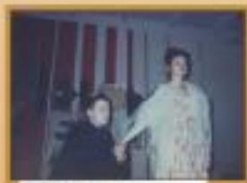
Актеры, 8 класс