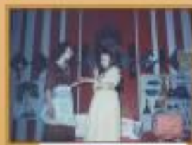
Актеры, 8 класс

В Гимназии всегда проходит много интересных творческих мероприятий. Традиционной стала Театральная весна.