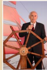
В.С. Лановой в кабинете А. Грина