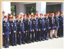
Кадетский класс на митинге