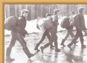
Мы готовы к трудностям