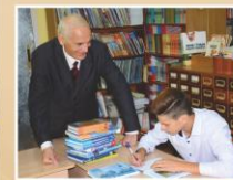
В библиотеке Гимназии