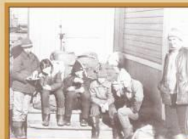
Приселен, друзья, перед дальней дорогой