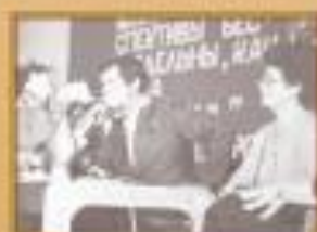
Встреча с гостем