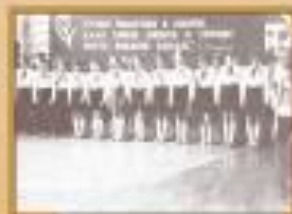
Встреча с гостем