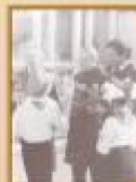
Встреча с гостем