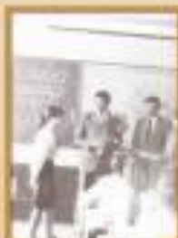
Встреча с гостем