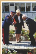
«Дымка» в подарок