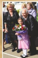
Вечные гриновские образы: Ассоль и Грзя