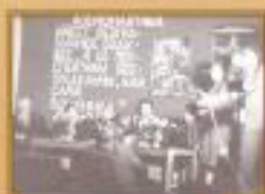
Встреча с гостем