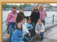
Пикники на организованных каникулах