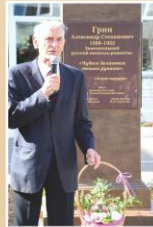
Выступление актёра В.С. Ланового

Памятник был передан в дар учебному заведению народным артистом СССР Василием Лановым и руководителем федерального проекта «Аллея российской славы» Михаилом Сердюковым.