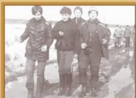
По пути в деревню Березкины