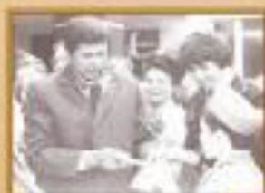
Встреча с гостем