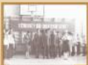
Встреча с гостем

7 мая 1986 года школа встретила 100-лет исследователя планеты, земляка Виктора Петровича Савиных. Гость соблаговолил в классы, на канцелярию. А на торжественной линейке он подарил маленькую звезду в знак любви Арктикофильской дружины.